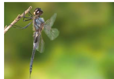
Libellulidae * Tamea binotata