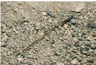
Pseudostigmatidae Mecistogaster sp. 2