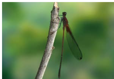
Calopterygidae * Hetaerina rosea