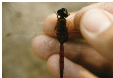
Libellulidae Tauriphila australis