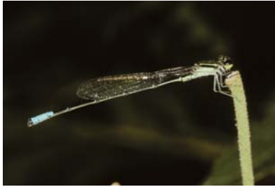
Coenagrionidae Acanthagrion sp. 1