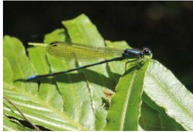
Coenagrionidae Argia sp. 1