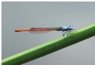
Protoneuridae Neoneura sylvatica