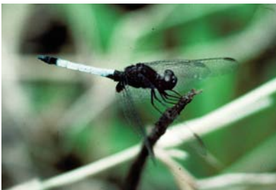
Libellulidae Erythrodiplax anomala