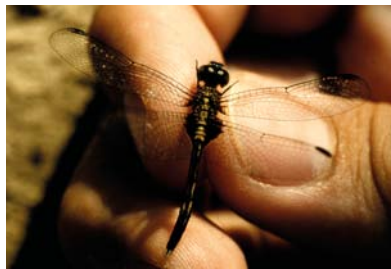
Libellulidae Erythrodiplax basalis