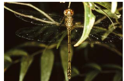
Libellulidae Macrothemis sp. 1