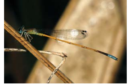
Coenagrionidae Leptagrion dardanoi