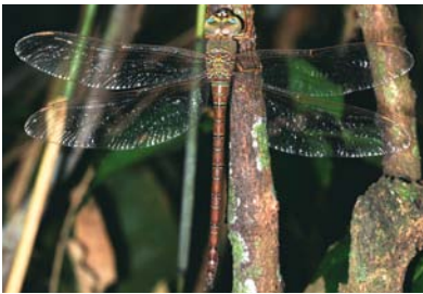
Aeshnidae Gynacantha nervosa