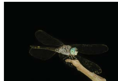
Libellulidae Micrathyria atra