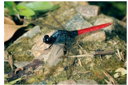
Libellulidae Erythemis peruviana