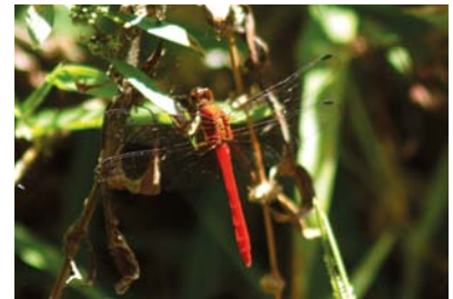
Libellulidae Erythrodiplax castanea