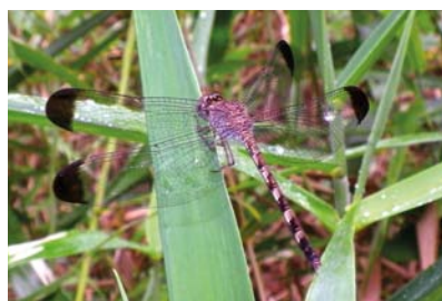
Libellulidae Uracis imbuta