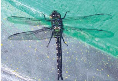
Aeshnidae Anax amazili