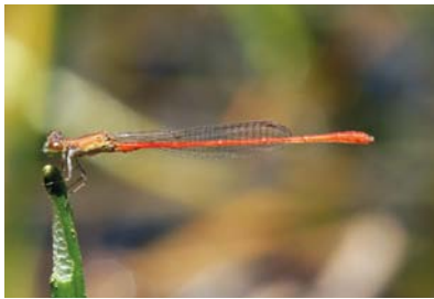
Coenagrionidae Telebasis sp. 1