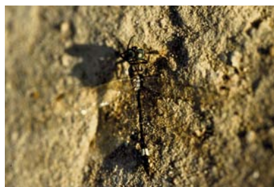
Libellulidae Micrathyria ocellata dentiensi