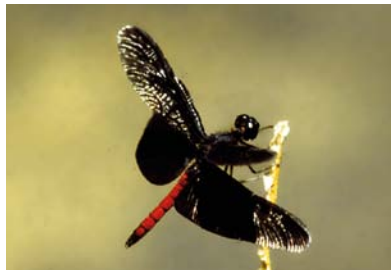
Libellulidae * Diastatops obscura