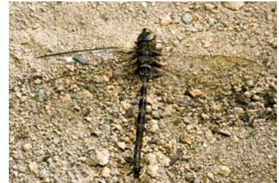
Aeshnidae Gynacantha gracilis