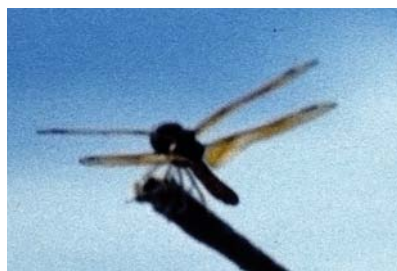
Libellulidae Perithemis mooma