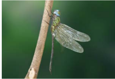
Aeshnidae Coryphaeschna adnexa