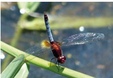
Libellulidae Erythrodiplax fusca