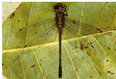
Libellulidae Macrothemis sp. 2