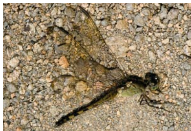
Libellulidae Erythrodiplax umbrata