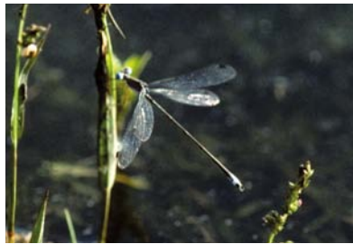
Lestidae Lestes sp. 1