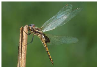
Libellulidae * Miathyria marcella