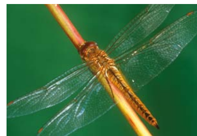
Libellulidae * Pantala flavescens