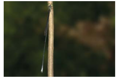
Pseudostigmatidae Mecistogaster sp. 1 ( lucretia ou linearis )