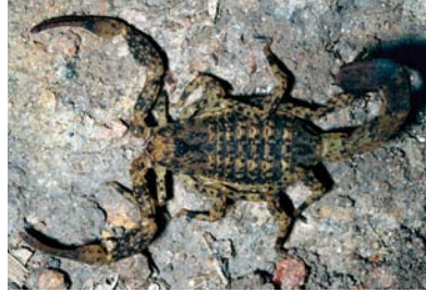
Buthidae Tityus pusillus