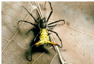
Araneidae Micrathena sp. 1