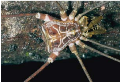
Gonyleptidae Acutisoma sp. 1