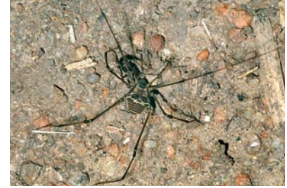
Cosmetidae Cynorta sp. 1