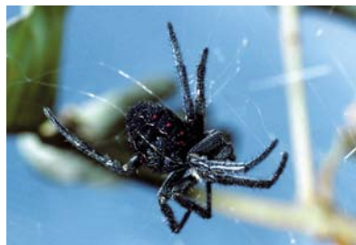
Araneidae Parawixia bistrata