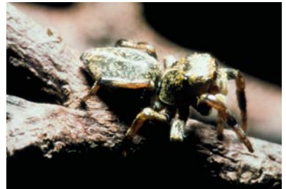
Salticidae Indet. sp. 1