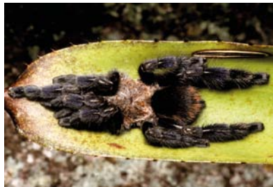
Theraphosidae Pachistopelma rufonigrum