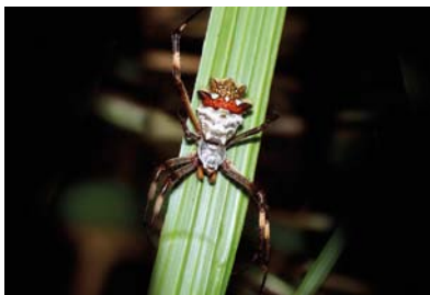
Araneidae Argiope argentata