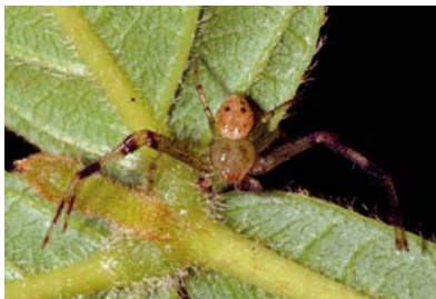
Thomisidae Indet. sp. 1