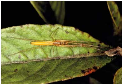
Tetragnathidae Tetragnatha sp. 1