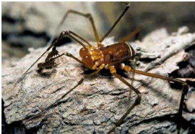
Stygnidae Pickeliana sp. 1