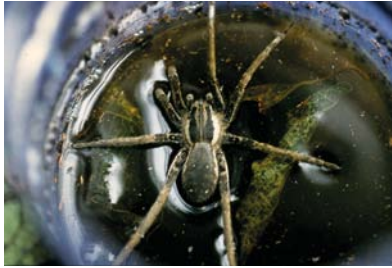
Ctenidae Ancylopetes sp. 1