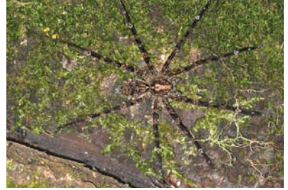
Ctenidae Enoploctenus sp. 1