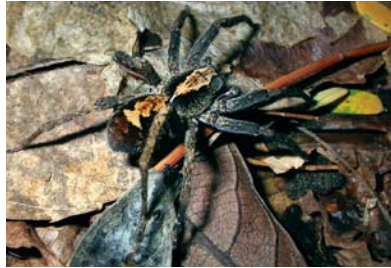
Ctenidae Ctenus rectipes