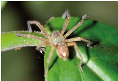
Sparassidae Indet. sp. 1