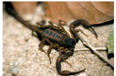
Buthidae Tityus brazila