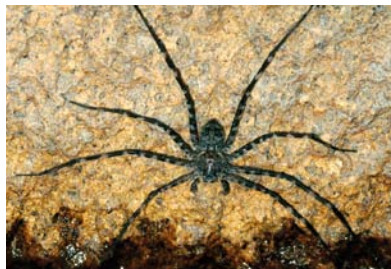
Trechaleidae Indet. sp. 1