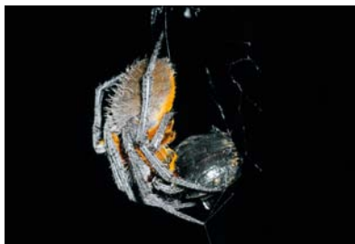
Araneidae Eriophora fuliginea