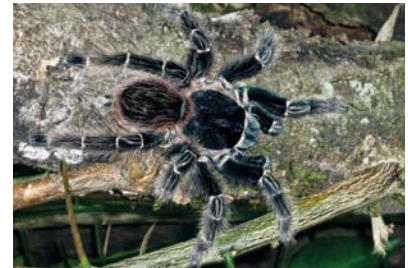
Theraphosidae Lasiodora parahybana