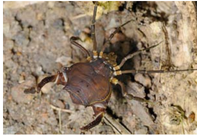
Gonyleptidae Pseudopucrolia discrepans