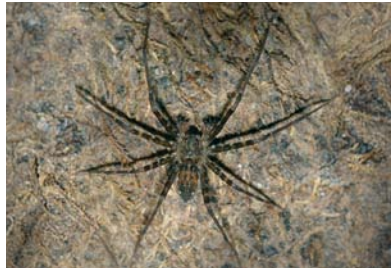
Pisauridae Indet. sp. 1