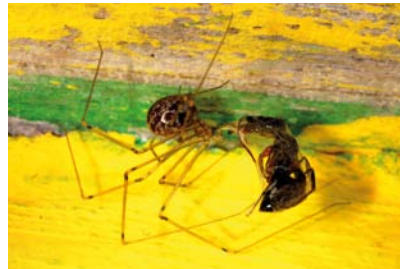
Theridiidae Indet. sp. 1