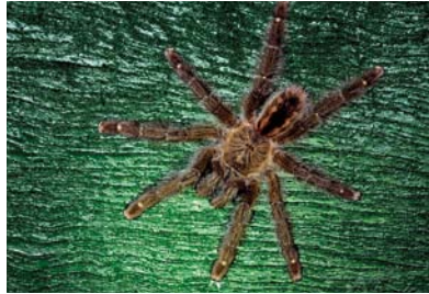
Theraphosidae Iridopelma hirsutum