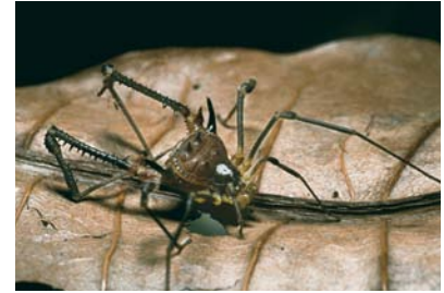
Gonyleptidae Indet. sp. 1