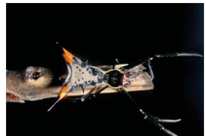
Araneidae Micrathena schreibersi