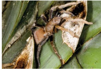
Theraphosidae Proshapalopus multicuspидatus