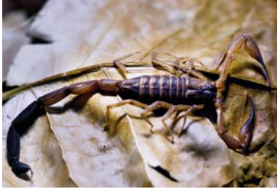
Buthidae Tityus neglectus