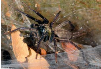
Dipluridae Linothele sp. 1