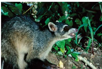
Procyonidae Procyon cancrivorus