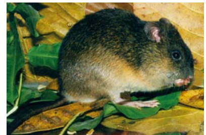
Muridae * Nectomys squamipes