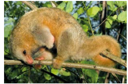
Cyclopedidae Cyclopes didactylus