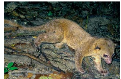
Procyonidae * Potos flavus