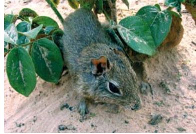
Caviidae * Galea spixii