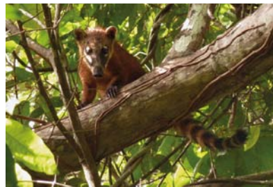
Procyonidae Nasua nasua