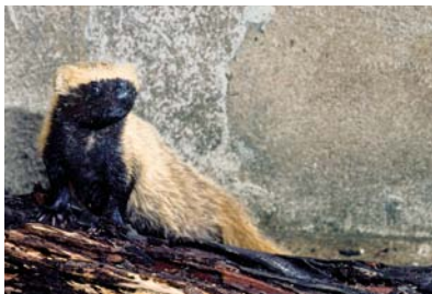
Mustelidae Galictis cuja