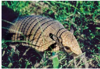
Dasypodidae Euphractus sexcinctus