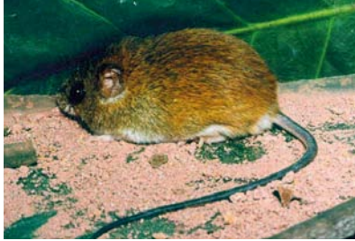
Muridae * Oligoryzomys stramineus