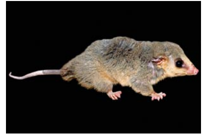
Didelphidae Micoureus demerarae