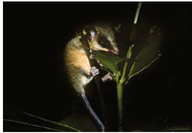
Didelphidae Marmosa murina