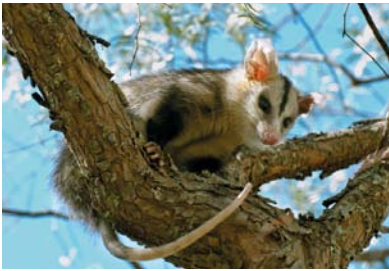
Didelphidae Didelphis albiventris