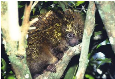
Erethizontidae Coendou (Sphiggurus) speratus