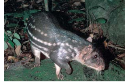
Cuniculidae Cuniculus paca