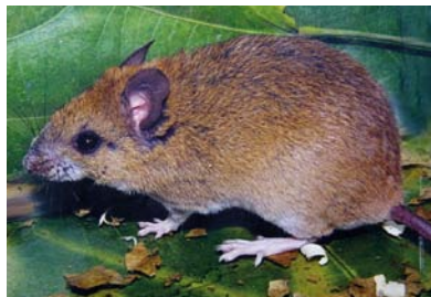
Muridae * Hylaeamys oniscus