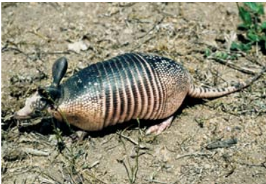
Dasypodidae Dasypus novemcinctus