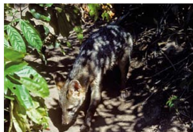
Canidae Cerdocyon thous