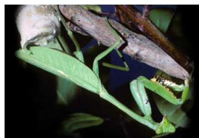
Mantidae Stagmatoptera aff. femoralis