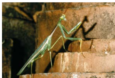
Mantidae Cardioptera parva