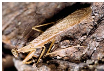
Thespidae Thespidae sp. 1