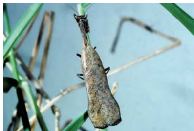
Acanthopidae Decimiana sp. 1 (macho)