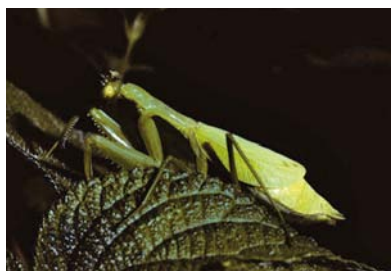
Mantidae Cardioptera sp. 1