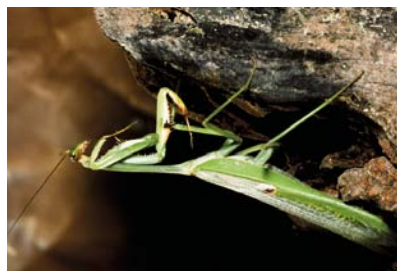
Mantidae Stagmatoptera sp. ( S. femoralis ou S. precaria )