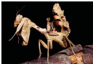
Acanthopidae Decimiana sp. 1 (fêmea)