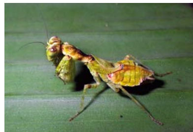
Acanthopidae Acontista sp. 1