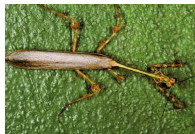
Mantidae Zoolea sp. 1